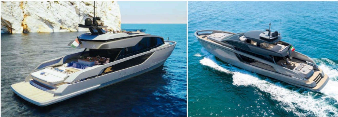
„X90 Fast“: Für die neuen 27 Meter fand Extra Yachts kürzlich einen Käufer, den eine Spitzengeschwindigkeit von 30 Knoten und ein Hauptdeck mit 86 Quadratmeter Außenbereich erwarten. Die 29 Meter lange „X98 RPH“ (r.) bewirbt die Werft aus Ancona mit 140 Quadratmeter großen Gästebereichen.