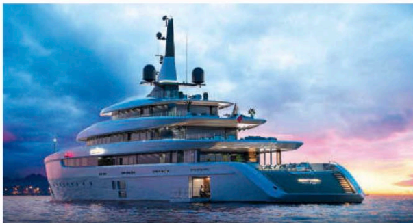
Projekt „Superleggera“: Oceanco stellte 17 Designern eine vorkonstruierte 80-Meter-Plattform bereit. Lumini zeichnete klar und wieder mit Kurvenheck.

Ein zentrales Element in den Arbeiten von Hot Lab ist Farbe. Die „Ipanema 50m“ von Mondomarine ist leuchtend rot gehalten. Die „Neptune 65m“ für Turquoise Yachts im namensgebenden Türkis, während die „Arcadia FOR.TH. 47m“ mit einem olivgrünen Rumpf aufwartet. Warum also weg vom klassischen Weiß? „Indem man mit Farben spielt, kann man einem Volumen mehr Bedeutung verleihen oder es verkleinern. Wenn ich auf dem Beiboot bin, weiß ich genau, wo sich meine Yacht befindet. Das geht auf zwei Wegen: Nachts spielt man mit Lichtern und tagsüber mit Farben“, sagt Enrico Lumini. Für die Ausweitung der Farbpalette gibt es noch einen anderen Grund. „Früher sind Sonderfarben schon nach einem Jahr aus