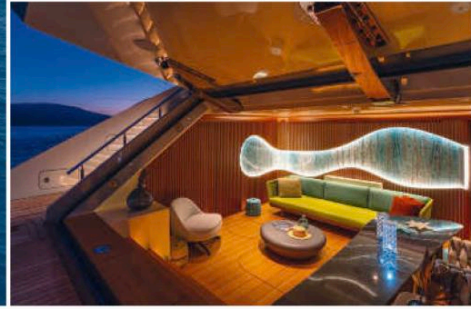
„Kasif“: Der Name der 45-Bilgin-Meter bedeutet Explorer auf Türkisch. Hot Lab entwarf innen wie außen für einen Fischfarm-Unternehmer.

richtige Identität in Bezug auf seinen Stil bekommen. Mit all unseren Mitarbeitern haben wir einen neuen Claim formuliert: Architecture for Voyagers“, erklärt Antonio Romano.