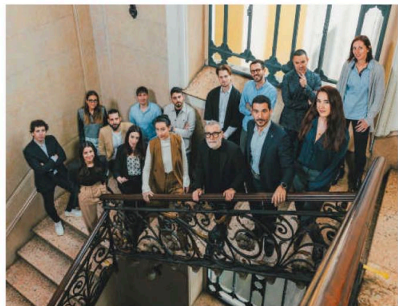
Neue Heimat: 2024 haben Hot Lab ihr Büro in der Via Giuseppe Revere in Mailand bezogen. Dort arbeiten 15 Mitarbeiter auf 352 Quadratmetern.