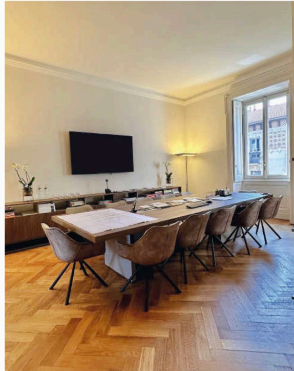
Besprechungsraum im Mailänder Studio von Hot Lab. Direkt daneben wurde eine Lounge eingerichtet, in der sich die Kunden entspannen.